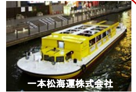
一本松海運株式会社

笑いあふれる水の都 大阪 私たちの町「なにわ」を流れる道頓堀川、東横堀川、木津川、堂島川を船で一周してみましょう! いつも渡っている橋の下をくぐったり、川でしか眺められない景色が見える! パナマ運河のような水門や非常に低い橋など波乱万丈!