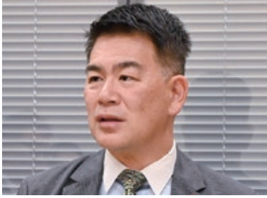
立憲民主党 大西健介 氏