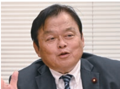
公明党 赤羽一嘉 氏