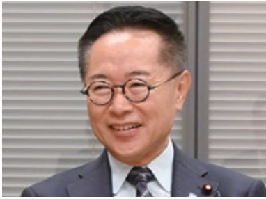
国民民主党 古川元久 氏