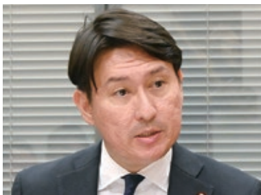
日本維新の会 斎藤アレックス氏