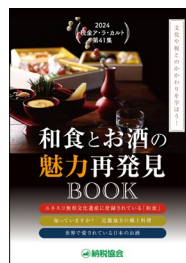
「税金ア・ラ・カルト（第 41 集）」