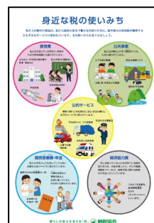
「身近な税の使いみち」