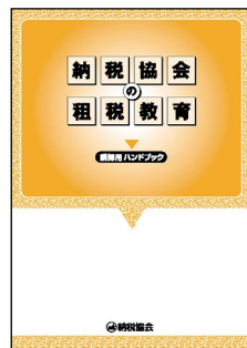
「納税協会の租税教育 (講師用ハンドブック)」