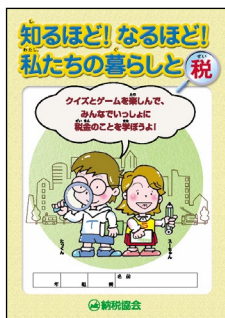
「知るほど！なるほど！ 私たちの暮らしと税」