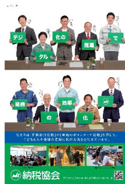
青年部会員を起用したポスター