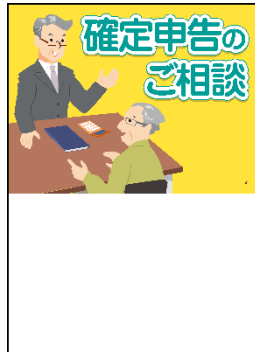
相談会場周知用ポスター(縦型)

確定申告期の「相談会場周知用」ポスター、縦横2種類を 2,560 枚作成して、各納税協会へ配付した。