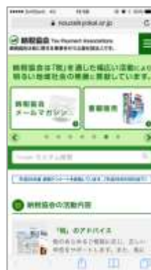
スマートフォンで表示したホームページ