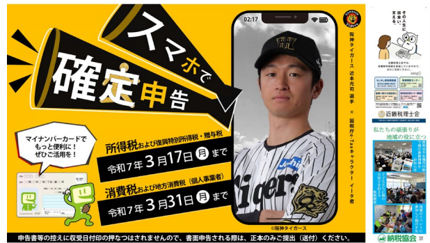
(デジタルサイネージ)