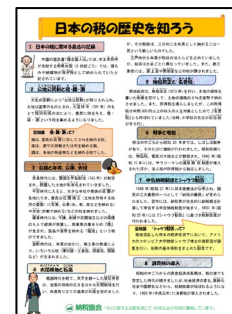
「日本の税の歴史を知ろう」